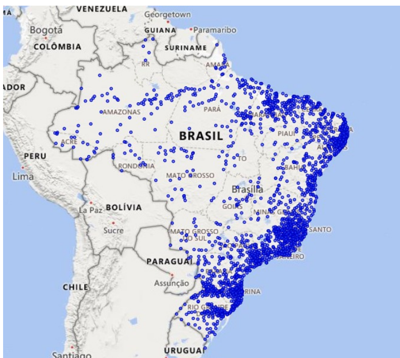
Figura 3 – Localização dos 1.942 municípios mais suscetíveis à ocorrência de deslizamentos, enxurradas e inundações.

40. Considerando a base de dados atualizada até 2022, foram gerados mapas com o auxílio da ferramenta Power Bi , a localização no território nacional dos 1.942 municípios mais suscetíveis (Figura 3).